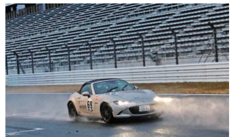
Roadster Class 優勝 96号車 高砂エアテックロードスター 酒井 仁 / 藤田 真哉 / 奈良 敬志 / 咲川 めり