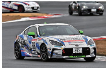
GR86/BRZ Class 総合1位 98号車 神奈川トヨタ☆DTEC GR86