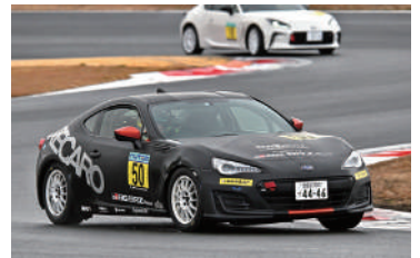
86/BRZ Class 総合23位 50号車 ATRACT/K BRZ