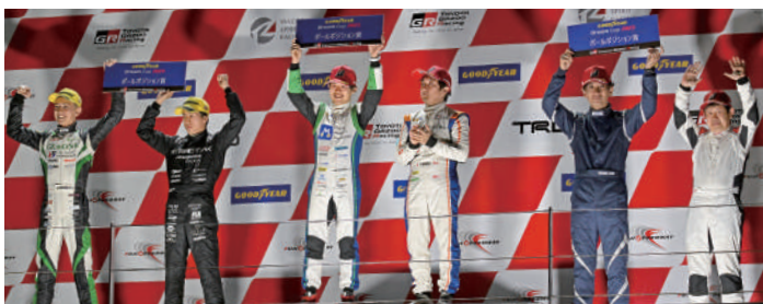
86/BRZ 50 ATTRACT/K BRZ GR86/BRZ 98 神奈川トヨタ☆DTEC GR86 ロードスター 28 CP大泉三差製作所ロードスター