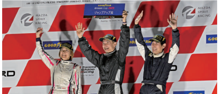
ジャンプアップ賞 Yaris Class 45号車/TCカスタマーレーシングYaris