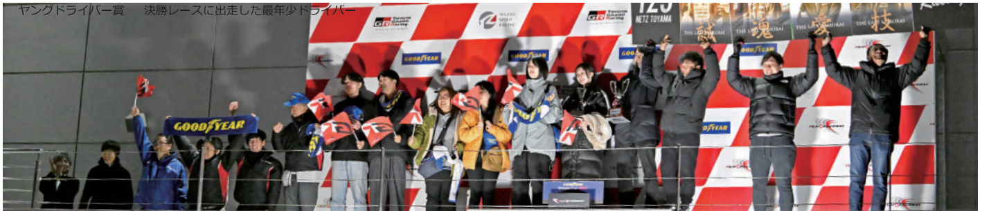
ベストサポート賞 Yaris Class 1号車/N中部GRGミッドレスノコ制動屋Yaris / Yaris Class 123号車/NETZ富山Racing Yaris

ベストサポート賞 決勝レースのスタート進行に応援者が多く、華やかなチーム ヤングドライバー賞 決勝レースに出走した最年少ドライバー