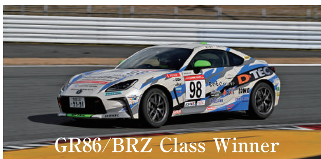
GR86/BRZ Class Winner

2023年12月16日(土)日本グッドイヤー株式会社様にご協賛いただき”GOODYEAR Dream Cup 2023”が開催された。6時間耐久レースとして12回目を迎え、新たにロードスター が加わり、6クラス63チーム (Yaris Class:35台・Yaris CVTClass:6台・GR86/BRZClass:5台・86/BRZClass:2台・VitzClass:9台・ロードスター Class:6台) 総勢205名のドライバーによって争われた。国内レースなどで活躍しているドライバーたちも参加し、2023年富士スピードウェイで開催された自動車レースを締めくくる大会に相応しい、素晴らしいレースが展開された。