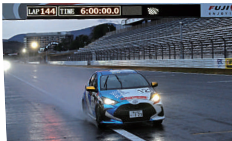
Yaris Class 優勝 123号車 NETZ富山RacingYaris 山口 竜也 / 松井 宏太 / 水野 大