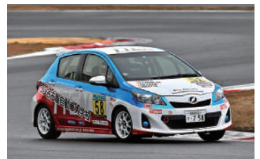
Vitz Class 総合24位 58号車 TTCNトヨタ名古屋校VITZ