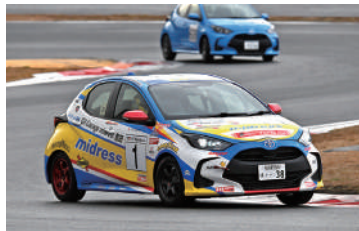
Yaris Class 総合3位 1号車 N中部GRGミッドレスノコ制動屋Yaris