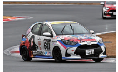
Yaris CVT Class 総合22位 680号車 ROKUHA Yaris CVT