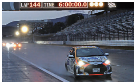
Yaris CVT Class 優勝 20号車 Tモビリティ神奈川Yaris CVT 乙津 竜馬 / 三浦 正貴 / 相馬 拓音