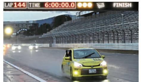
Vitz Class 優勝 628号車 チームいなふおとラヴィッツ 堀内 秀也 / 今井 恵二 / 稲垣 之治 / 松本 知