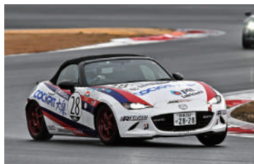
Roadster Class 総合13位 28号車 CP大泉三差製作所ロードスター