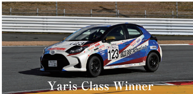
Yaris Class Winner