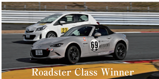
Roadster Class Winner

Yaris CVT Class 20号車 Tモビリティ神奈川Yaris CVT 乙津 竜馬 / 三浦 正貴 / 相馬 拓音